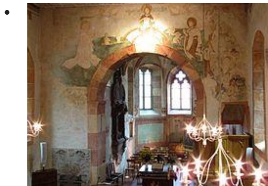
Vue intérieure de la nef vers le chœur