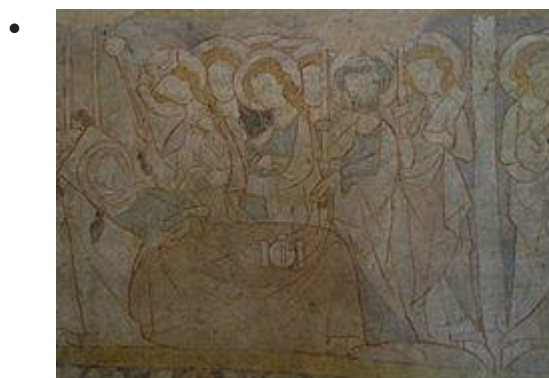
Vie de Marie (Dormition)