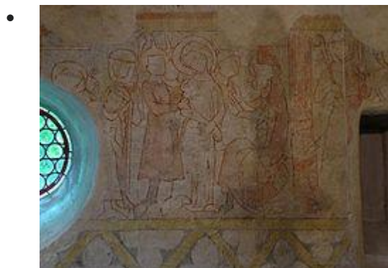
Passion du Christ (Jésus devant le Sanhédrin)