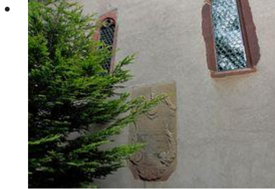
Plaque funéraire (XVIIIe)