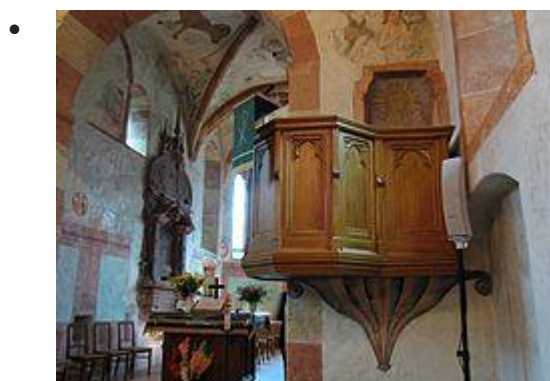
Chaire à prêcher