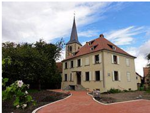
Vue de l'église et du presbytère

https://commons.wikimedia.org/wiki/%C3%89glise_protestante_(Baldenheim)?uselang=fr