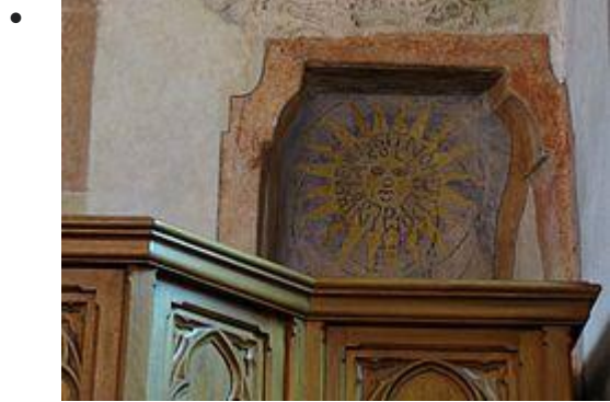
Fresque "Symbole du soleil" (XVIe)