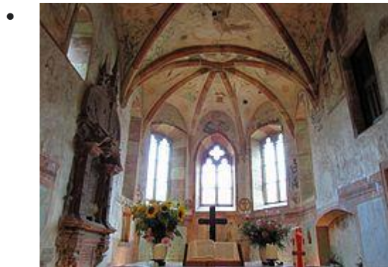
Vue d'ensemble du chœur