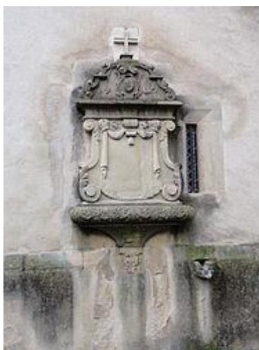
Plaque funéraire (XVIIIe)