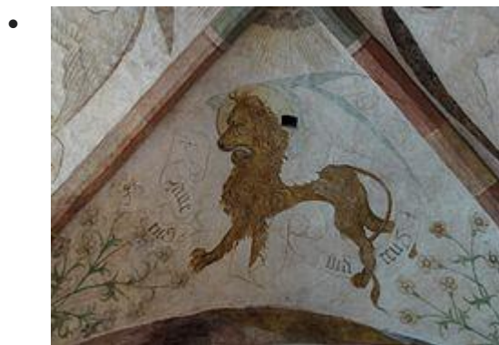
Lion de St-Marc