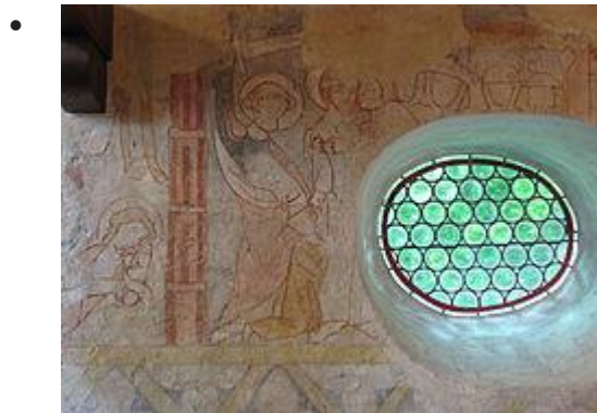
Jardin de Gethsémané, Pierre coupe l'oreille d'un serviteur, Baiser de Judas