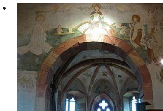
Fresque "Jugement dernier" (XVe) de l'arc triomphal