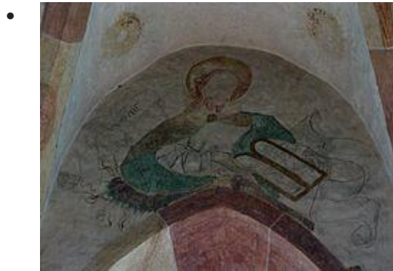
Moïse avec le buisson ardent et les tables de la Loi