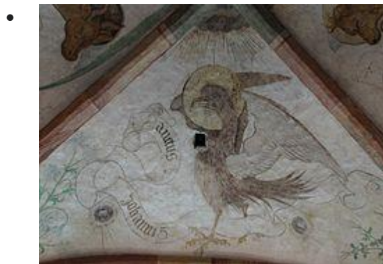
Aigle de St-Jean