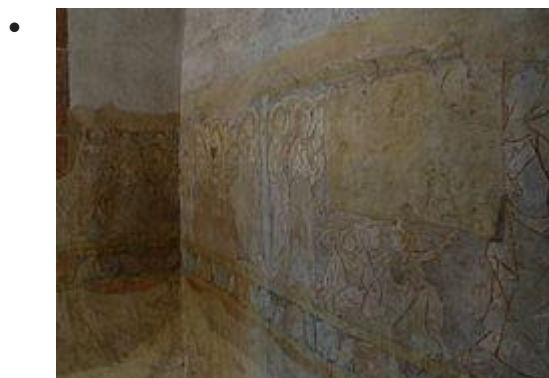
Vie de Marie (Dormition et enterrement de Marie)