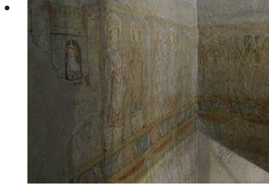
Saints et Saintes