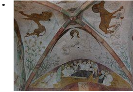
Tétramorphe, Ange de St-Mathieu et Dormition de la Vierge