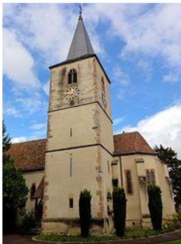
Clocher et nef