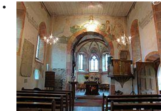
Vue intérieure de la nef vers le chœur