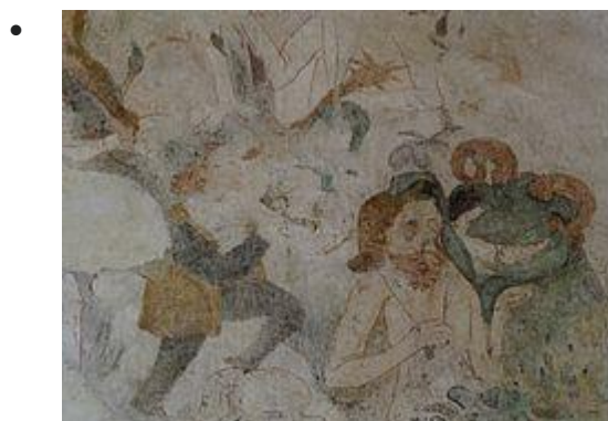
Fresque "Jugement dernier": Enfer