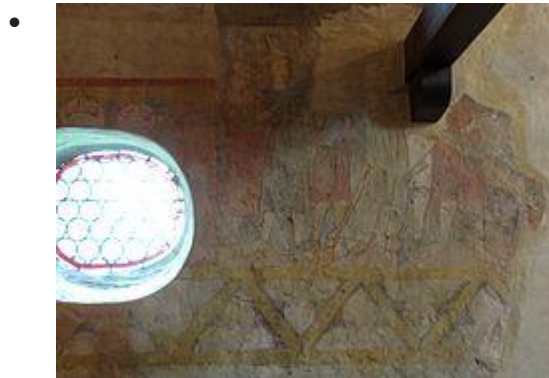
Passion du Christ (Reniement de Pierre)