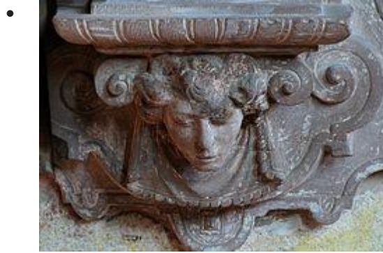
Détails de la plaque funéraire (XVIe)