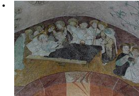
Dormition de la Vierge