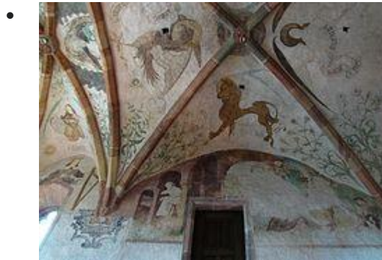
Roi David et l'ange musicien (XVe), Nativité (dégradée) et Joseph en train de préparer le repas (XVIe)