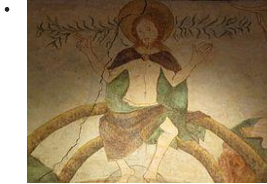
Fresque "Jugement dernier": Christ en majesté