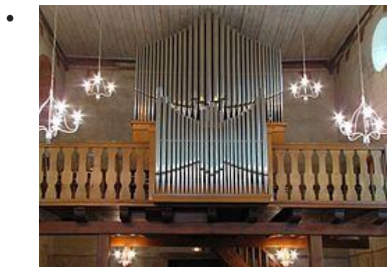
Orgue Muhleisen (1964)