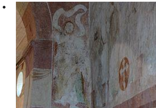
Apôtre et croix encerclée (une église consacrée par un évêque était marquée de 12 croix semblables)