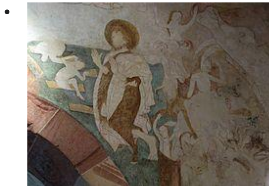
Fresque "Jugement dernier": Paradis et Enfer