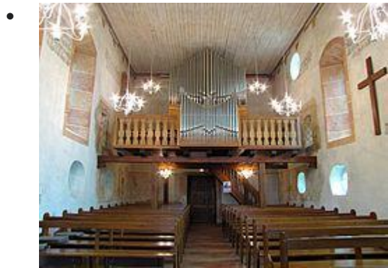
Vue intérieure de la nef vers la tribune d'orgue