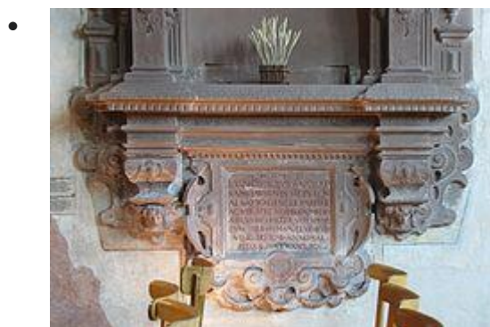
Détails de la plaque funéraire (XVIe)