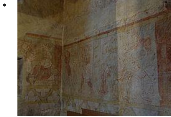
Passion du Christ (Ponce Pilate, Flagellation, Jésus couronné d'épines)