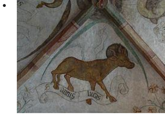
Bœuf de St-Luc