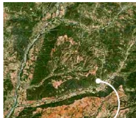
le vieux Bras