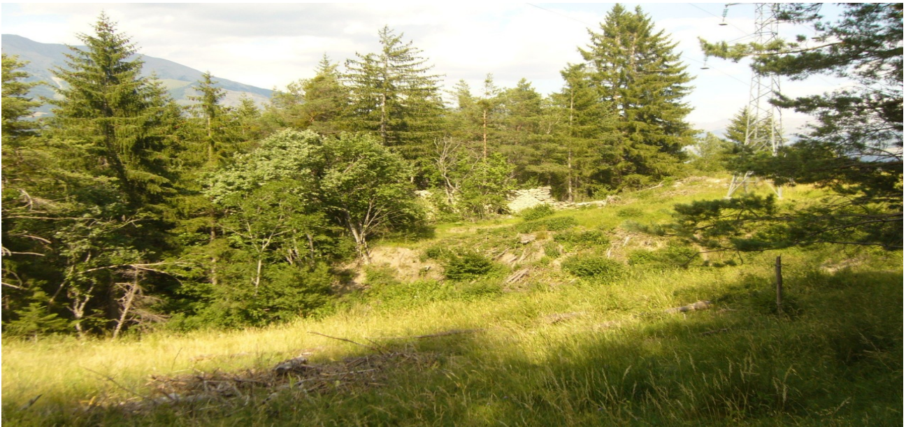
Ruines du hameau des Jauberts

Difficile de se rendre sur place pour visiter le lieu. Une amie guide de pays m'avait prévenue, mais nous y conduit avec plaisir. Nous partons du Pied de La Maure, vers Les Chapeliers, puis nous montons à travers bois au dessus de la rive gauche de l'Ubaye. Le chemin se perd dans la forêt. Torrents, éboulements et chutes d'arbres ont effacé le sentier muletier et bientôt tout chemin. Les habitants d'autrefois, ces jardiniers de la montagne, ne sont plus là et le paysage se ferme. Les terrasses de cultures s'écroulent, envahies de genévriers, d'égantiers et de pins. La forêt inexploitée et non entretenue est devenue inhospitalière, et certainement vulnérable avec le changement climatique.